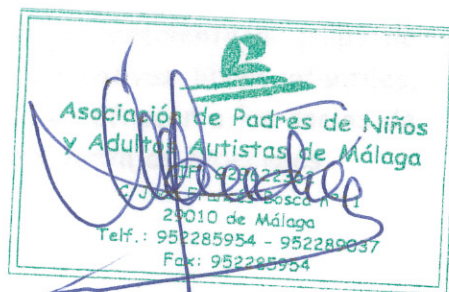
Fdo.: Miguel Sánchez Carreón Autismo Málaga